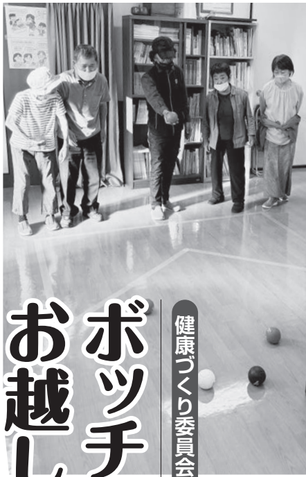
健康づくり委員会