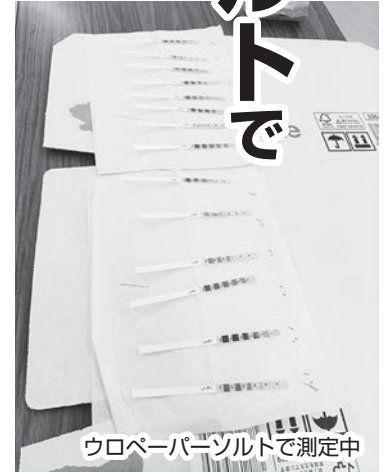
ウロペーパーソルトで測定中

はじめに、保健大学のシジメを使いながらすこしおについて見識を深め、次に「塩分摂取自己チェック表」を使ってそれぞれの塩分摂取量の確認。その後、ウロペーパーソルトで測定