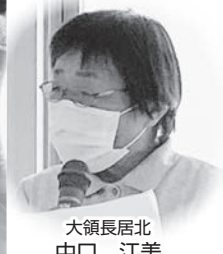
大領長居北 中口 江美